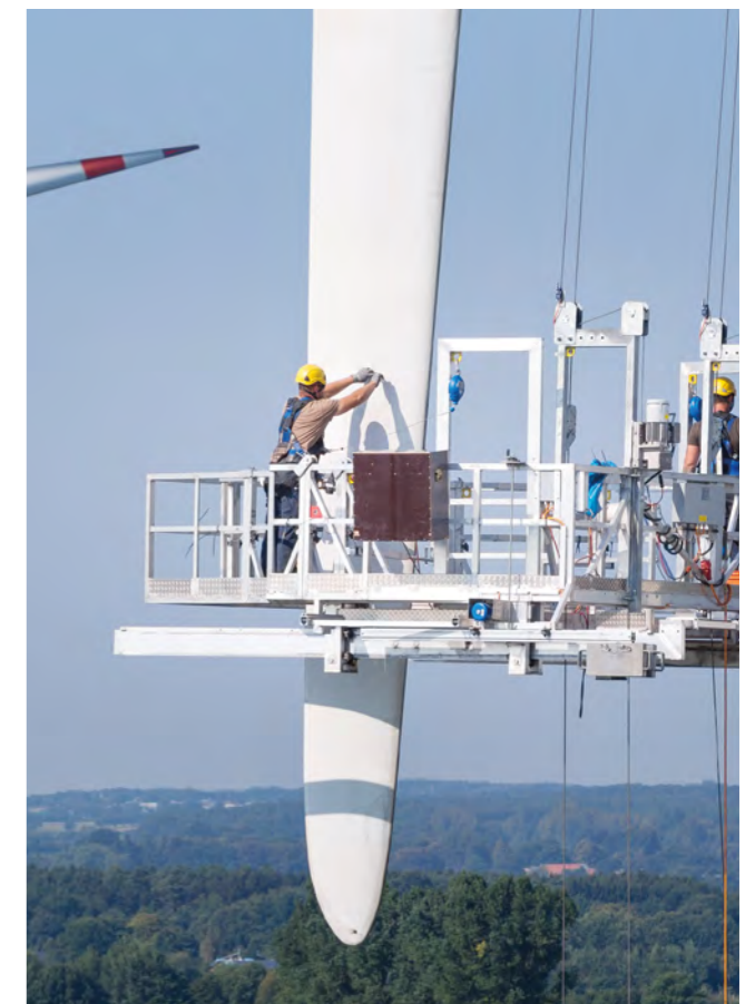
Die Betreiberinnen bzw. Betreiber sind für den ordnungsgemäßen, betriebssicheren Zustand der Anlage verantwortlich.

der Betreiberin bzw. des Betreibers nicht behoben, können die erforderlichen Maßnahmen auch mit Zwangsmitteln (z. B. Zwangsgeld) durchgesetzt werden. Auch eine sofortige Stilllegung aufgrund bauordnungsrechtlicher Mängel ist rechtlich möglich, musste bisher jedoch noch nie angeordnet werden. Hat die Betreiberin bzw. der Betreiber fahrlässig oder vorsätzlich gegen vollziehbare baurechtliche Nebenbestimmungen oder Anordnungen verstoßen, kann die untere Bauaufsichtsbehörde auch ein Ordnungswidrigkeitsverfahren einleiten.