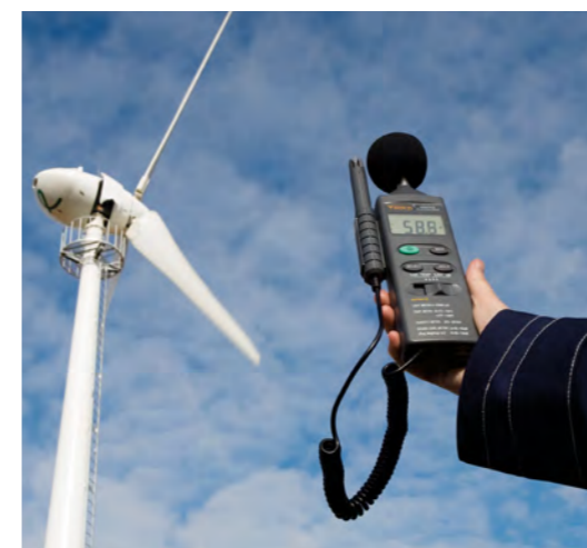
Nach der Abnahmemessung werden weitere Lärmmessungen nur aus besonderem Anlass oder bei Beschwerden aus der Bevölkerung durchgeführt.

Wird festgestellt, dass die Allgemeinheit oder die Nachbarschaft nicht ausreichend vor schädlichen Umwelteinwirkungen oder sonstigen Gefahren, erheblichen Nachteilen oder erheblichen Belästigungen geschützt ist, soll die Genehmigungsbehörde sogenannte nachträgliche – das heißt nach Erteilung des Genehmigungsbescheides – Anordnungen treffen (§ 17 BImSchG).