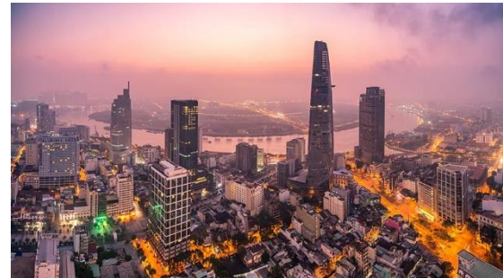
Bild: Skyline Ho Chi Ming City

Das Hoheitsgebiet von Vietnam zieht sich von der Grenze zu China bis hin zum Golf von Thailand. Die Landessprache ist Vietnamesisch, doch auch Englisch nimmt stets an Bedeutung zu. Das Klima unterscheidet sich drastisch zwischen Nord- und Südvietnam. Der Norden weist ein gemäßigtes tropisches Wechselklima auf, es gibt eine kühle Jahreszeit von November bis April und eine heiße von Mai bis Oktober. Der Süden ist tropisch: warm bis sehr heiß während des ganzen Jahres. In Südvietnam kann die Luftfeuchtigkeit bis zu 80% ansteigen und über 35 °C werden.