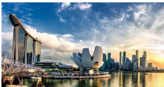
Bild: Skyline Marina Bay, Singapur

Das Hoheitsgebiet besteht aus der Insel Singapur und mehr als 60 kleineren, angrenzenden Inseln. Die vier offiziellen Landessprachen sind Englisch, Mandarin, Malaiisch und Tamil. Unter den ca. 5,7 Mio. Einwohnern Singapurs sind rund 1,2 Mio. ausländische Arbeitnehmer. Die von nahezu allen gesprochene und verstandene Geschäftssprache ist Englisch. Die Temperaturen in Singapur bewegen sich während des ganzen Jahres relativ konstant bei durchschnittlich 28 °C (Minimum 23, Maximum 33 °C), die Luftfeuchtigkeit liegt bei durchschnittlich 84%.