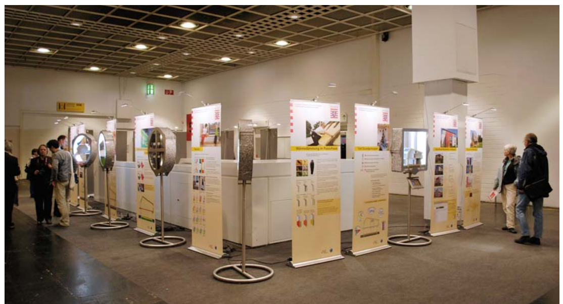
Ausstellungspräsentation auf der Passivhausmesse in Frankfurt am Main.