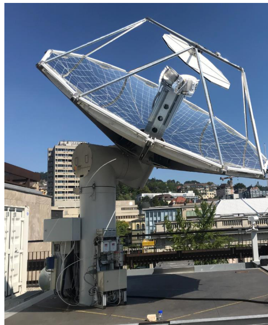
Abbildung 3: StL-Laboranlage auf dem Dach der ETH Zürich. Der Reaktor ist das Gerät im Fokus des Parabolspiegels.

Der von der Firma Capphenia entwickelte Prozess zur Herstellung von Synthesegas ist ein Hybridprozess, der Merkmale von PtL und