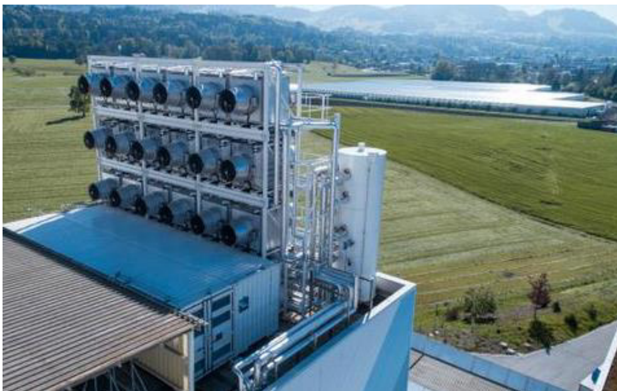
Abbildung 2: Anlage von Climeworks zur Gewinnung von CO 2 aus der Atmosphäre in Hinwil.

Nachteil der Gewinnung des CO 2 aus der Umgebungsluft sind vor allen Dingen die damit verbundenen Kosten, die von Climeworks gegenwärtig auf 600 EUR/Tonne CO 2 geschätzt werden. 77 Da für die Produktion von einer Tonne Kerosin stöchiometrisch 3,15 Tonnen CO 2 benötigt werden, entspricht dies 1.890 EUR/Tonne Kerosin. Für die für 2020 geplanten, größeren Anlagen wird allerdings mit einer Halbierung der Kosten pro Tonne CO 2 gerechnet. 78